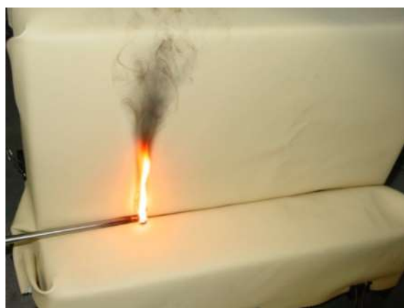
布張り家具の試験 (Part 8)