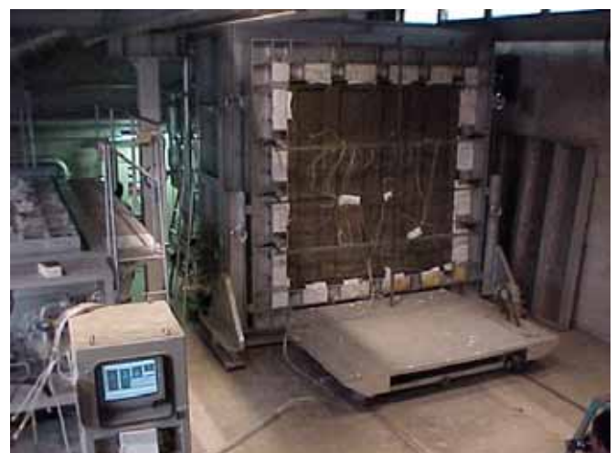
図 1 標準火災試験炉 (Part 3)

ここで、T は炉内平均温度( ) t は試験開始からの時間(分)である。この式に従えば、加熱開始後 10 分で T は 678 、30 分後には 842 、60 分後には 945 となる。試験中は、試験体を通ってくる高温ガスや煙を観測するとともに、試験体の非加熱側の温度を測定して、定められた断熱性能があるか評価する。(仕切り隔壁、甲板、防火戸、窓、防火ダンパー、電線貫通部等が本試験にて評価される。)