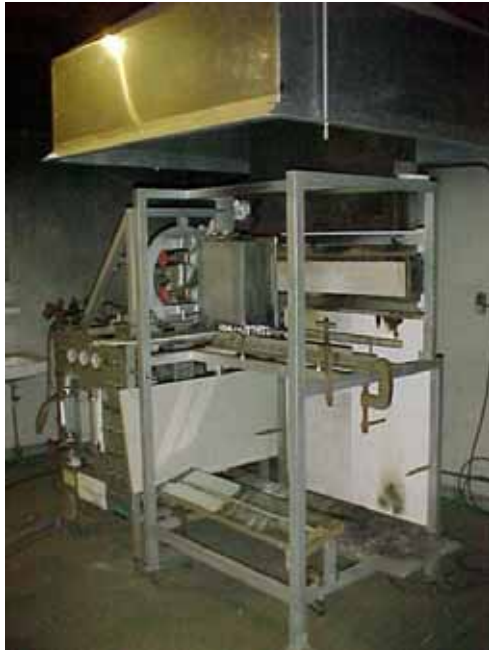
図3 火炎伝搬性試験機 (Part 5)