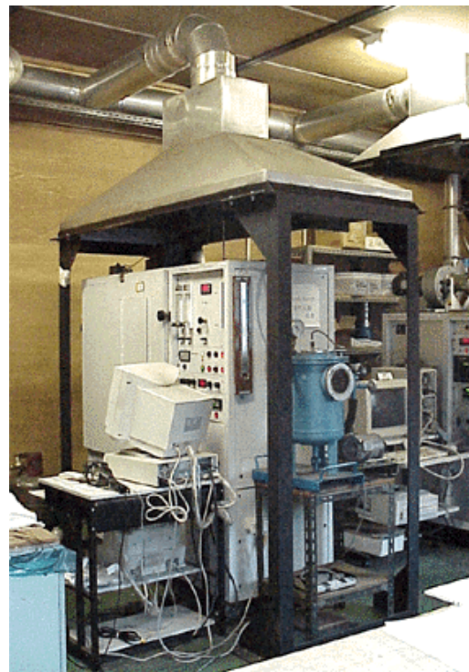
図 2 発煙性試験および燃焼ガス毒性試験 (Part 2)

また、火災試験方法コードでは、一次甲板床張り材の試験方法が大きく緩和された。従来、一次甲板床張り材としては、甲板プレートをスムーズに仕上げる為のモルタル系(セメントベース)の基材と考えられ、IMO A.214 を試験方法として使用されていたが試験としても厳しい規格であった。FTP コードに移行した後は、FTP コード Part 6 として定められ、以前と比較して、試験的にはとてもゆるい規格へと変わっている。これは、セメントベースの一次甲板床張り材が、HSC(高速船)等の設計における自由度を阻害することになる為、新しい考え方が取り入れられ、新素材等の使用に道を開いたといえる。具体的な試験内容は、表面燃焼性試験(FTP コード Part 5)とほぼ同等である。(但し、試験体基材は、3mm 厚さの鋼板に限定されている。)