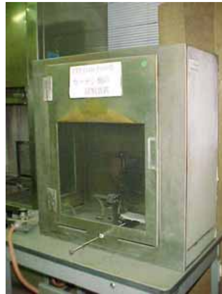
図4 カーテン類の燃焼試験機 (Part 7)

FTP コード Part10 及び Part11 については、国内での実施事例はまだない。しかしながら、近年の高速船の増加に伴い防火に関する設備の軽量化が要望されており、従来の防火の考え方を高速船に適用するのは困難な状況となってきた。Part 10 と Part11 の試験は、製品安全評価センターとしても今後対応していく予定である。以下に将来に係ることから Part 10 と Part11 について若干詳細な説明を付加させていただく。