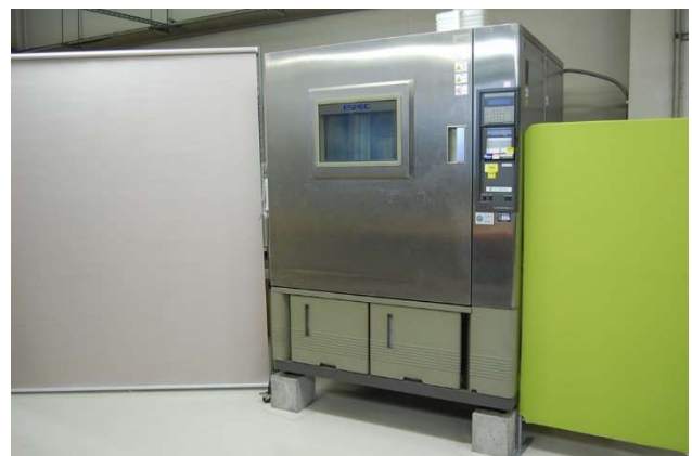
恒温恒湿槽 (PL-4SP 型)