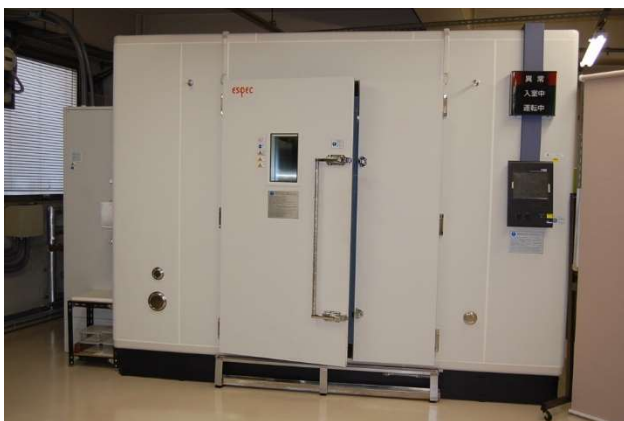
恒温恒湿室 (TBE-3EW 型)