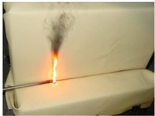
布張り家具の試験 (Part 8)