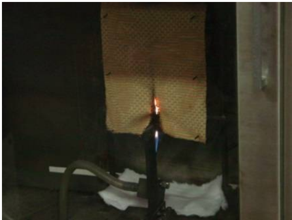
カーテンの試験 (Part 7)